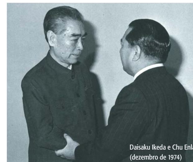
Daisaku Ikeda e Chu Enlai (dezembro de 1974)

Durante a Guerra Fria, o Oceano Ártico ocupava uma posição geopolítica estratégica. Submarinos nucleares do Oriente e do Ocidente viajavam sob o gelo, transportando ameaçadoras cargas de mísseis balísticos. Se, como resultado do aquecimento global, a camada de gelo polar diminuir ou mesmo desaparecer durante os meses de verão, isso facilitaria a militarização da região