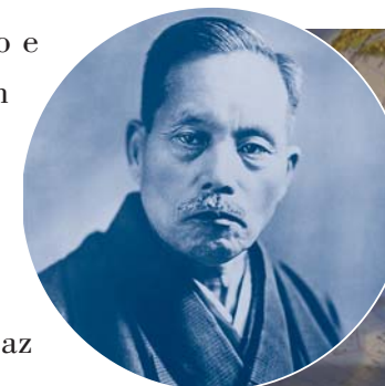
Tsunessaburo Makiguti e sua obra Geografia da Vida Humana , publicada em 1903.