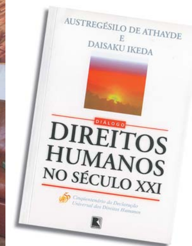
O diálogo de Austregésilo de Athayde e Daisaku Ikeda resultou no livro Direitos Humanos no Século XXI , Editora Record