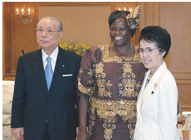
Em sua visita ao Japão, Wangari Maathai foi recebida pelo casal Ikeda (Tóquio, 18 de fevereiro de 2005)

O projeto “Plantemos para o Planeta: Campanha do 1 Bilhão de Árvores”, promovido pelo Pnuma, a princípio inspirado nas idéias da Dra. Maathai, é uma estimulante iniciativa popular mundial para minimizar os efeitos da mudança climática. Com 1,9 bilhão de árvores já plantadas durante 2007, a campanha é um enorme sucesso. Em 2008, o objetivo é plantar outro bilhão. Isso fornecerá importantes oportunidades de aprendizado experimental. Espero que os trabalhos para a Década das Nações Unidas da Educação para o Desenvolvimento Sustentável sejam aprofun-