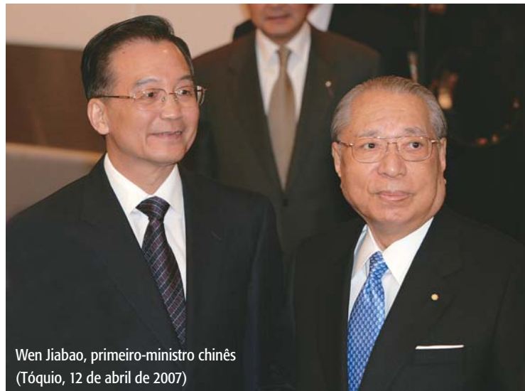
Wen Jiabao, primeiro-ministro chinês (Tóquio, 12 de abril de 2007)

Há quatro décadas me ergo pela normalização