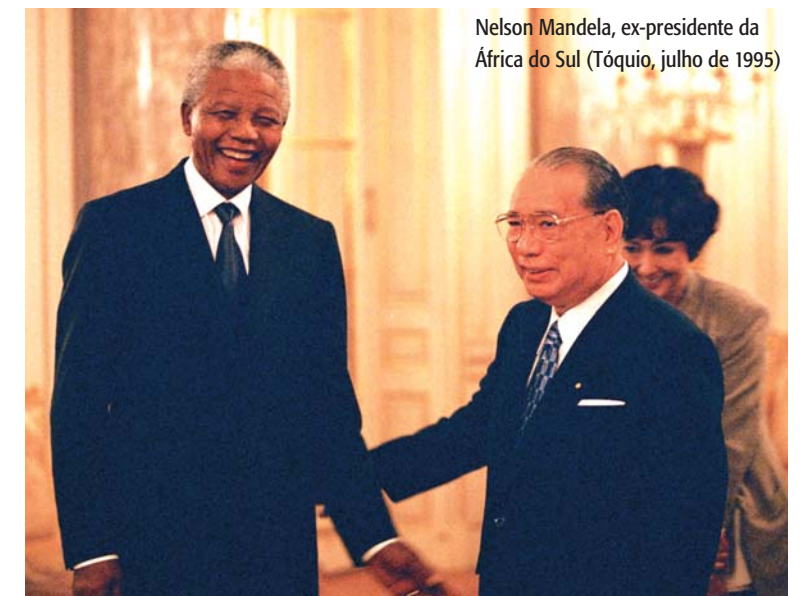
Nelson Mandela, ex-presidente da África do Sul (Tóquio, julho de 1995)

Não quero com isso atenuar a gravidade das questões que a África enfrenta. Há ainda conflitos, como os da região do Darfur e da Somália, e também terrível pobreza e condições desespera-