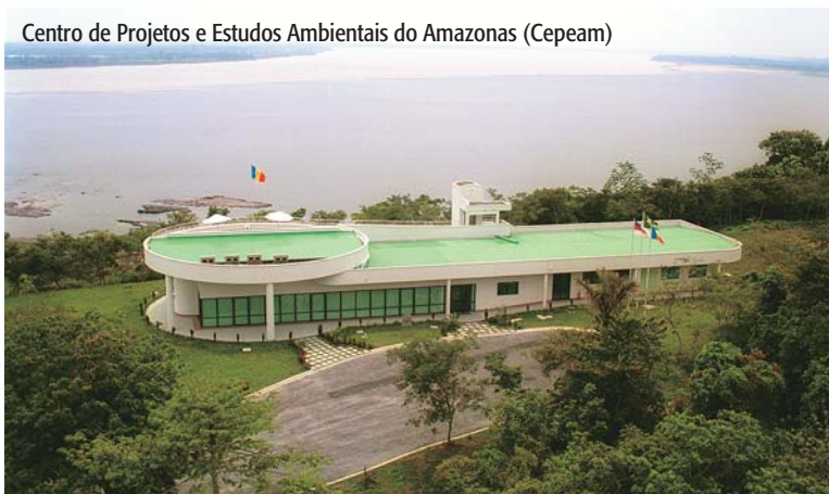
Centro de Projetos e Estudos Ambientais do Amazonas (Cepeam)

Apenas adquirir conhecimentos sobre questões ambientais não basta para justificar a Década da Educação para o Desenvolvimento Sustentável. É vital que os indivíduos percebam, de forma tangível, o valor insubstituível do ecossistema, do qual eles são parte, e se comprometam com a proteção dele. Essa consciência seria melhor desen-