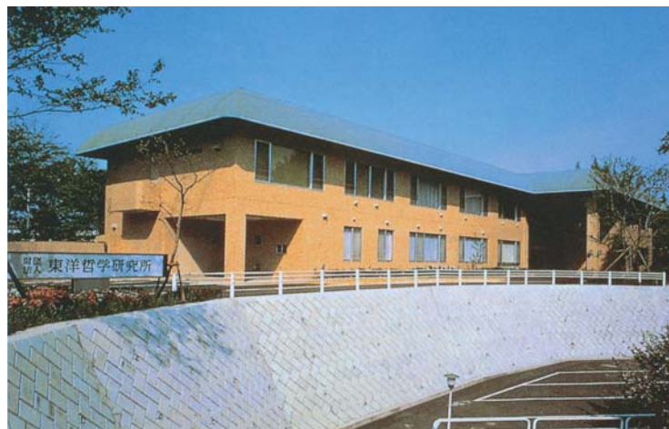
Instituto de Filosofia Oriental (IFO)

Com o trágico legado de fanatismo e intolerância, a religião necessita de um diálogo vital para transcender o dogmatismo e confirmar-se no exercício da razão e do autodomínio. Negar o diálogo é negar a razão de ser da própria religião. A SGI considera que, para promover o humanismo budista, basta hastear a bandeira do diálogo. Por mais ameaçadoras que sejam as forças do fanatismo rejeitador, da desconfiança ou do dogmatismo, esta é condição sine qua non do humanismo.