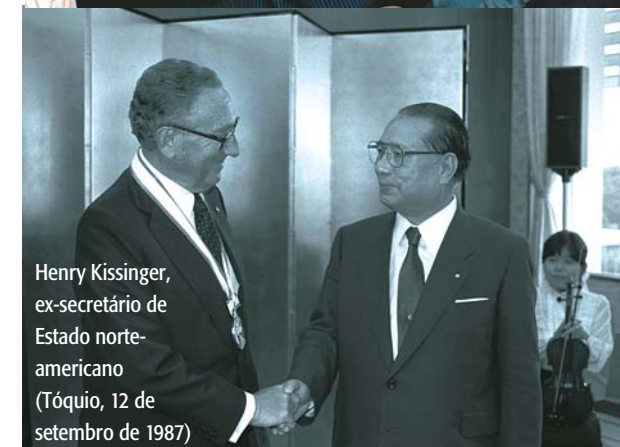
Henry Kissinger, ex-secretário de Estado norte- americano (Tóquio, 12 de setembro de 1987)

Ártica e provocaria uma escalada internacional para desenvolver transportes, exploração do solo oceânico e de outras fontes, ocasionando um conflito de interesses entre os países envolvidos. Por essa razão, torna-se urgente proibir a atividade militar na região, criar um regime legal para con-