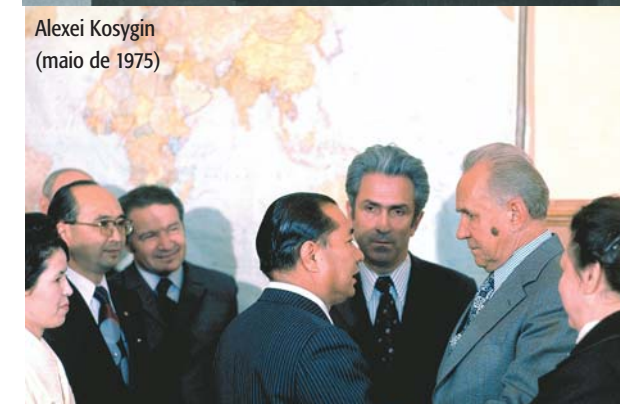
Alexei Kosygin (maio de 1975)