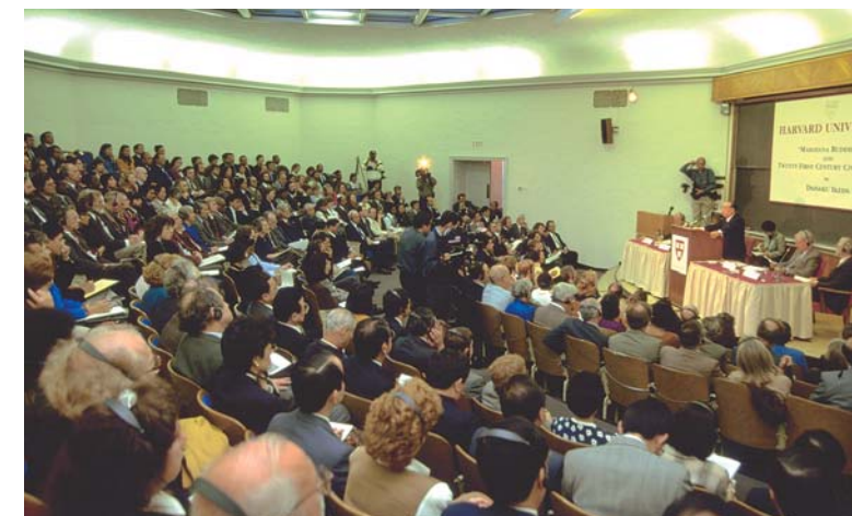
Daisaku Ikeda proferiu o discurso “O Budismo Mahayana e a Civilização do Século XXI”, na Universidade de Harvard (24 de setembro de 1993)

Este é o brado irreprimitível da consciência: expressão veemente da necessidade de se humanizar a religião.