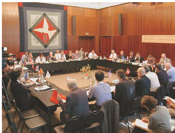
Conferência internacional realizada pelo Instituto Toda para a Paz Global e Pesquisa de Políticas (Moscou, junho de 2001)