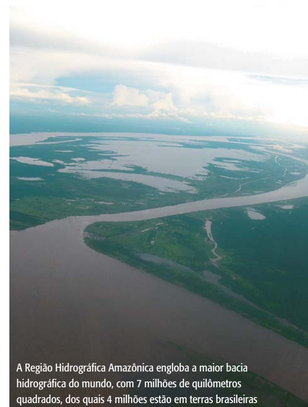
A Região Hidrográfica Amazônica engloba a maior bacia hidrográfica do mundo, com 7 milhões de quilômetros quadrados, dos quais 4 milhões estão em terras brasileiras

pendentes de revisão, em vez de aprovar orçamentos predeterminados para cada região e doença. Os membros do Conselho Administrativo do Fundo representam não apenas os governos mas também o setor privado, ONGs de países desenvolvidos e em desenvolvimento, bem como grupos de advogados de pacientes. Todas as partes possuem igualdade de voz e de voto, o que assegura que seus diversos pontos de vista sejam