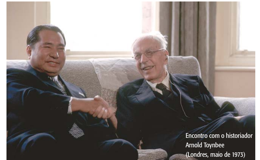
Encontro com o historiador Arnold Toynbee (Londres, maio de 1973)

dade. Sócrates declarou: “Não há maior sofrimento para um homem do que ouvir argumentos de ódio. A misologia (ódio à linguagem) e a misantropia (ódio aos homens) têm a mesma origem”.[21] O físico e filósofo alemão Carl Friedrich von Weizsacker (1912–2007), irmão do ex-presidente da Alemanha, com quem tive o privilégio de dialogar em 1991, define os seres humanos como “nossos verdadeiros companheiros de vida e de conversas”.[22] Nesse sentido, ele também considera o diálogo como essência do ser humano.