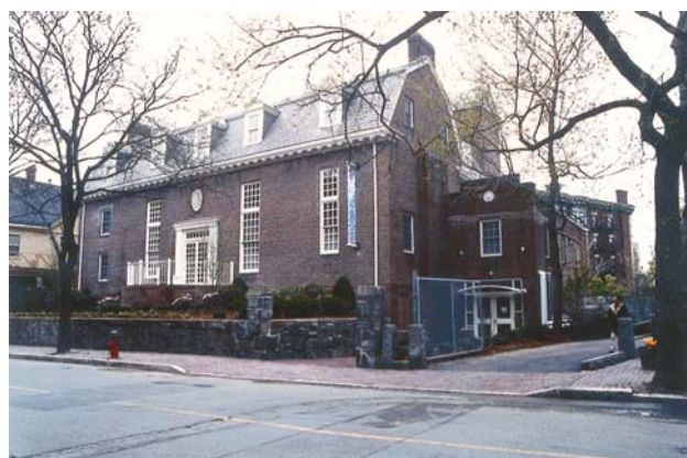
Centro de Pesquisas para o Século XXI de Boston (BRC)

O diálogo abandonado no meio do processo é insignificante. Somente a constância e a convicção o tornam fecundo. Como Homo sapiens , precisamos empreender uma luta espiritual. Isso requer que evidenciemos algumas virtudes: generosidade, resistência e sabedoria. Para serem dignas do nome, as religiões precisam de meios que desenvolvam essas qualidades. Devem promover uma mudança revolucionária nos seres humanos. Eis por que focalizei, em meu discurso em Harvard, o papel fundamental que o Budismo Mahayana pode desempenhar na civilização do século XXI. Esta é a minha convicção.