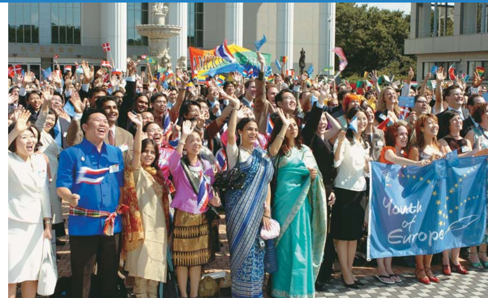
Jovens da SGI (Tóquio, 14 de setembro de 2005)

É minha convicção que se a China, a Coreia do Sul e o Japão, em sintonia com a Asean, continuarem trabalhando com tenacidade, será pos-